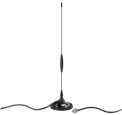
RF Magnet-Antenne 868 MHz 5db mit TNC-Stecker

Typ RF Magnet-Antenne 868MHz 5db TNC-Stecker IP 65