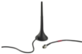
RF Magnet-Antenne 868 MHz