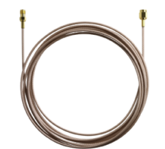
RF SMA Antennenverlängerung