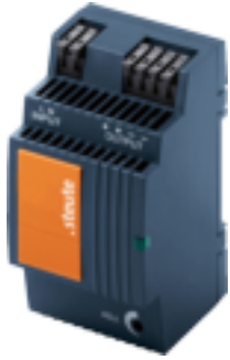
Netzteil 24 V DC