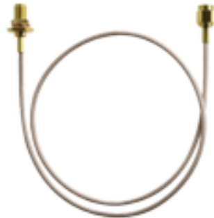
RF SMA Antenneneinbaubuchse