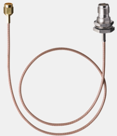
RF SMA Antenneneinbaubuchse mit TNC-Stecker

Typ RF SMA Antenneneinbaubuchse 0,5 m TNC-Stecker IP 65