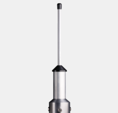
RF Sperrtopf-Antenne 868MHz