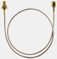
RF SMA Antenneneinbaubuchse